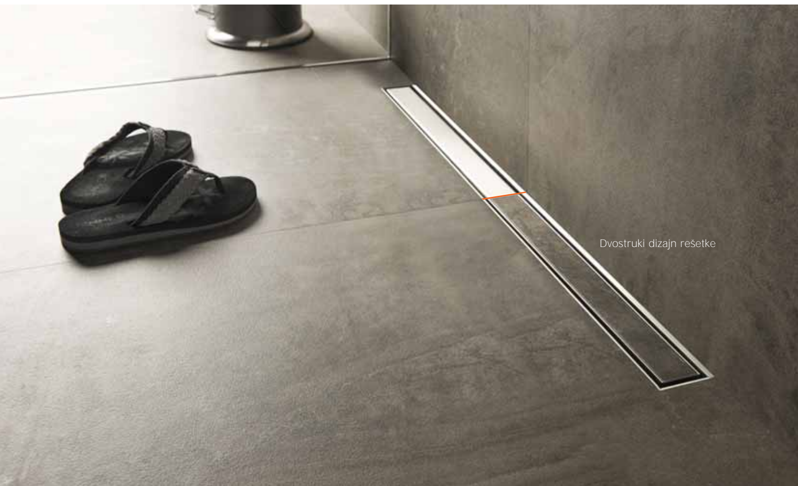
Dvostruki dizajn rešetke