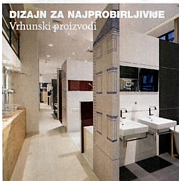
DIZAJN ZA NAJPROBIRLJIVJE Vrhunski proizvodi