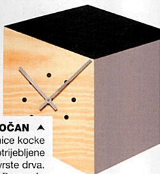
TOČAN ▲ Za stranice kocke „Cube“ upotrijebljene su različite vrste drva. Domestic, cijena na upit