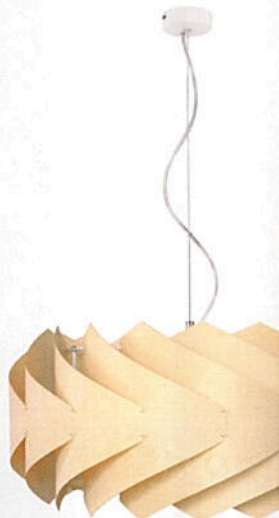
OSVIJETLJENA ▲ „Bebop“ se sastoji od savijenih elemenata od javorova drva. Dreizehngrad, od oko 3.800 kn

Stablo u kući 2 Wood Night: Javor, jasen i ostali donose promjenu u spavaću sobu