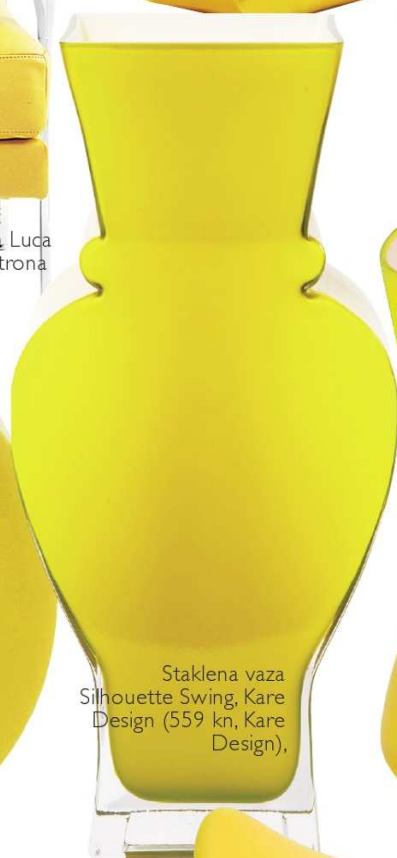
Staklena vaza Silhouette Swing, Kare Design (559 kn, Kare Design),