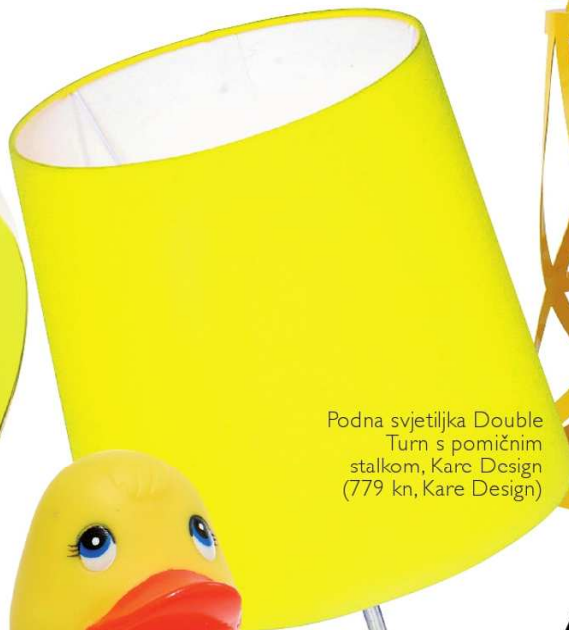
Podna svjetiljka Double Turn s pomičnim stalkom, Kare Design (779 kn, Kare Design)