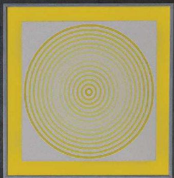
Kada Paper, dizajn Giovanna Talocci za Teuco (Špina)