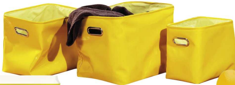
Lakirane kutije Tony od poliuretana (u više dimenzija, od 80 kn, Emmezeta),