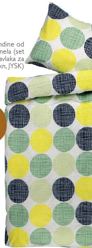
Posteljina Bendine od pamučnog flanela (set jastučnica i navlaka za pokrivač, 90 kn, JYSK)