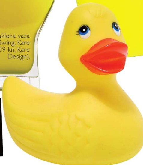
Plastična patkica za kupanje Plitsch Platsch, Kare Design (19 kn, Kare Design)