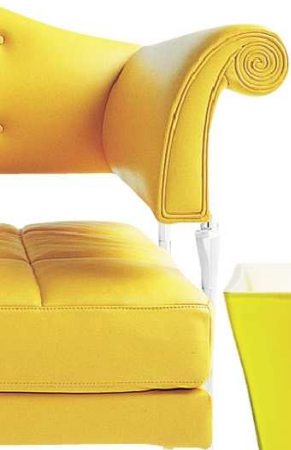
Kožnati naslonjač Hydra Enif, dizajn Luca Scacchetti za Poltrona Frau (Themelia)