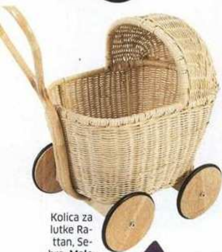
Kolica za lutke Rattan, Sebra, Male stvari, 650 kn