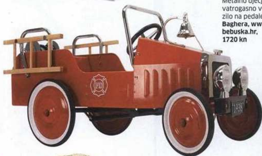
Metalno dječje vatrogasno vozilo na pedale, Baghera, www.bebuska.hr , 1720 kn