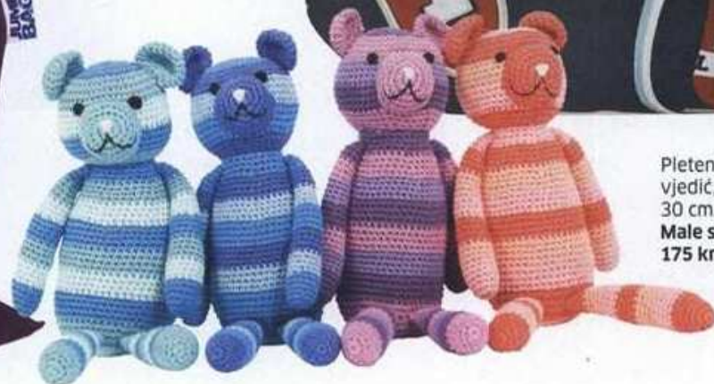
Pleteni medvjedić, visina 30 cm, Sebra, Male stvari, 175 kn