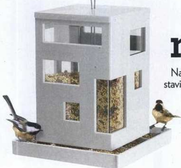
Kućica za ptice, Home Sweet Home, cijena na upit

Najbolje je da svojim mališanima (naravno, ako možete) pod bor stavite ono čime su vas pilali mjesecima. Možda neka od ovih stvari?