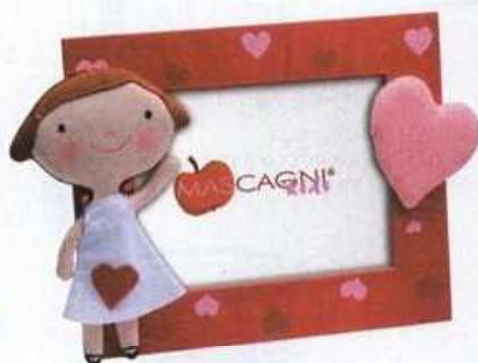
Okvir za fotografije, Mascagni, Home Sweet Home, 110 kn

Vreća za sjedenje Jumbo Bag Scuba, presvlaka vodootporna, punjenje stiropor iz Knaufa, dimenzije 140 x 180 cm, Kika, 749 kn