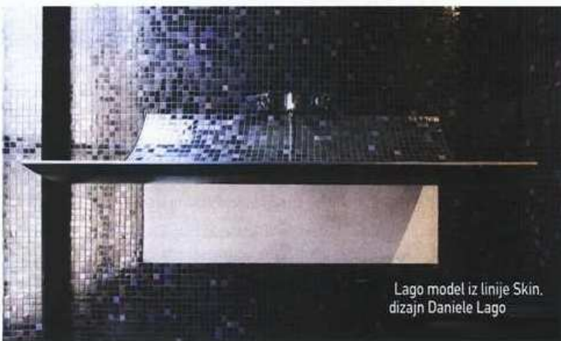
Lago model iz linije Skin. dizajn Daniele Lago