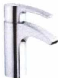
3. Schmidler Racing kromirani