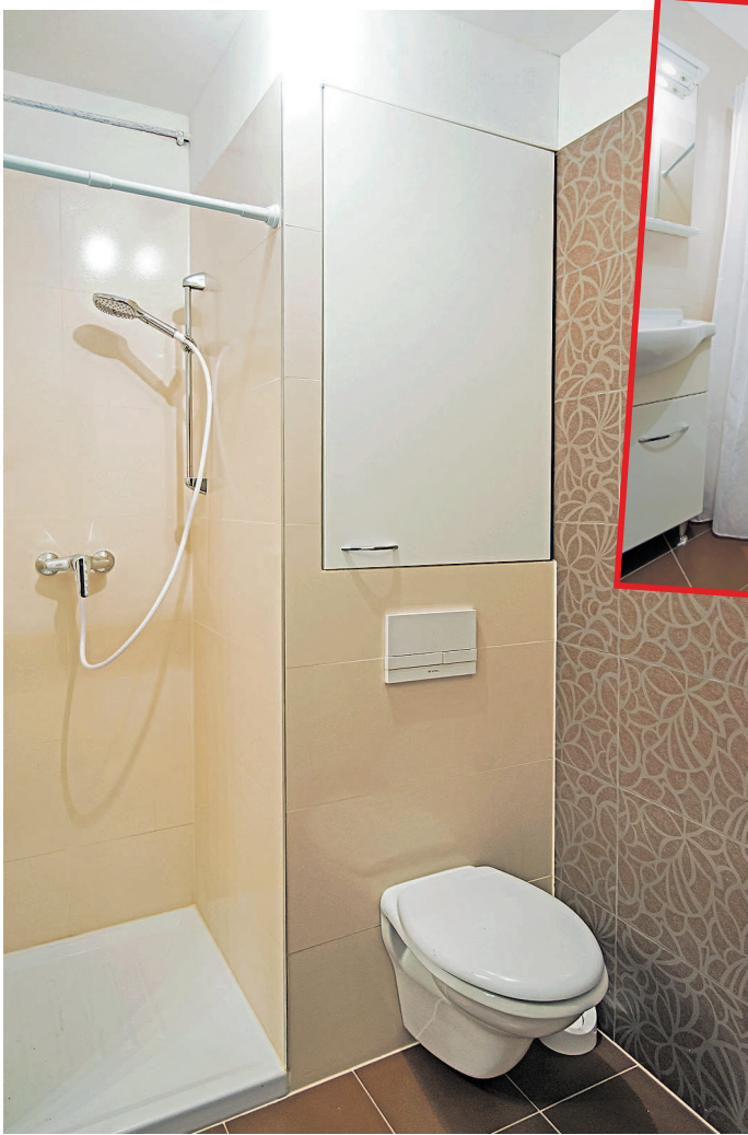
Nova tuš-kada neznatno je odignuta od poda pa se jednostavnije koristi, a WC školjka ne dodiruje pod, što olakšava održavanje kupaonice