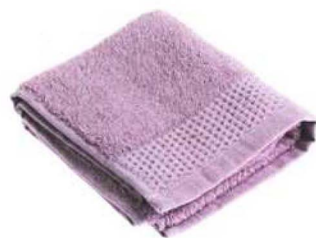
ljubičasti pamučni ručnik, 30x60 cm - 13,99 kn, Magma Home