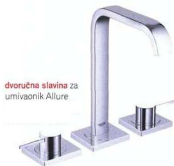
dvoručna slavina za umivaonik Allure

zidne pločice iz kolekcije Stardust, 18x36 cm - 225,52 kn/m 2 , dekor - 213,75 kn/kom, podne 33,3x33,3 cm - 234,52 kn/m 2