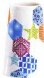
porculanska čaša za četkice - 125 kn, House Doctor, Bakina škrinja