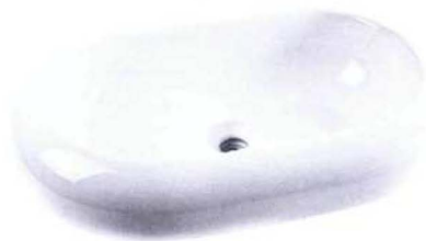
samostojeći ovalni umivaonik