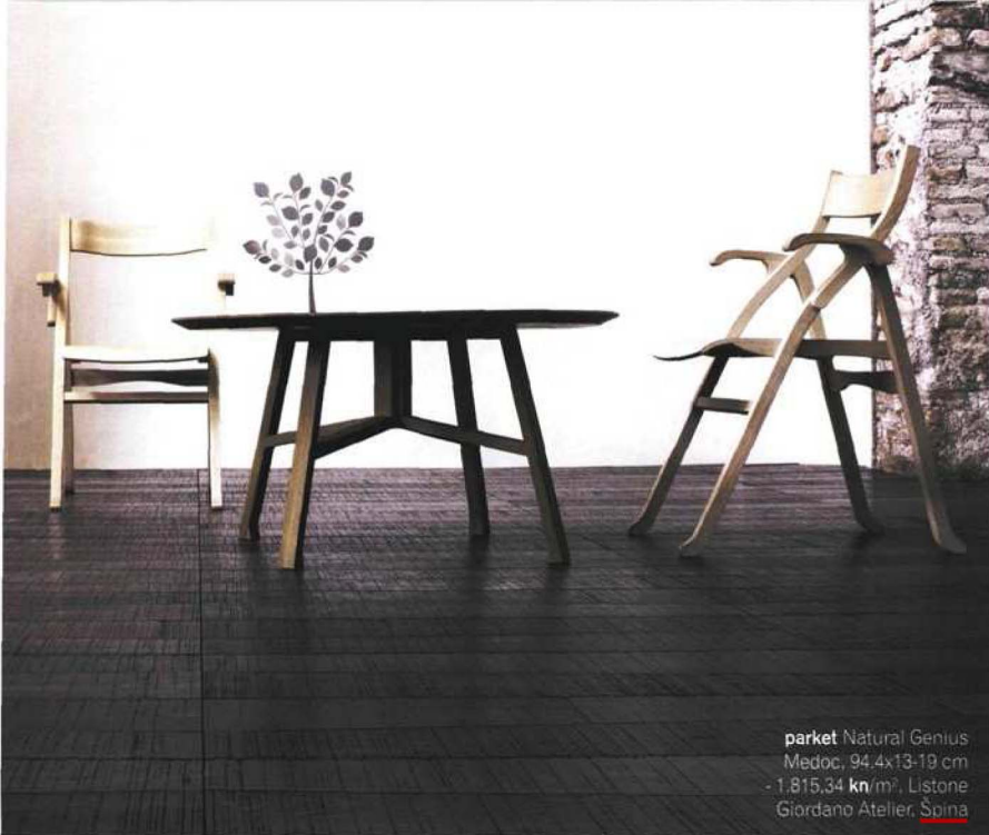
parket Natural Genius Medoc, 94,4x13-19 cm - 1.815,34 kn/m 2 , Listone Giordano Atelier, Spina