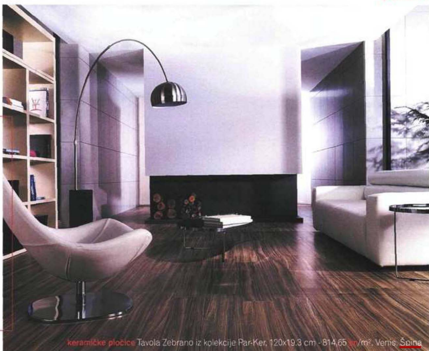
keramičke pločice Tavola Zebrano iz kolekcije Par-Ker, 120x19,3 cm - 814,65 €/m 2 , Veris, Španja

Ako želite nove pločice na podu, nije nužno obaviti cijeli stan u prašinu trgajući stare pločice - one se jednostavno mogu polagati jedne na druge. Važno je samo dobro očistiti površinu starih pločica i, naravno, imati u vidu da će novi pod biti neznatno viši od starog.