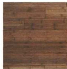
parket od bambusa, 96x9,6 cm

lako bambus nije drvo, već spada u porodicu trava, svojim karakteristikama predstavlja ozbiljnu konkurenciju najkvalitetnijim drvenim parketima. Vrlo je izdržljiv i čvrst, otporan na oštećenja, a tvrdoća mu premašuje čak i hrastov parket. Uz sve to, ekološki je vrlo prihvatljiv jer se jako brzo obnavlja!