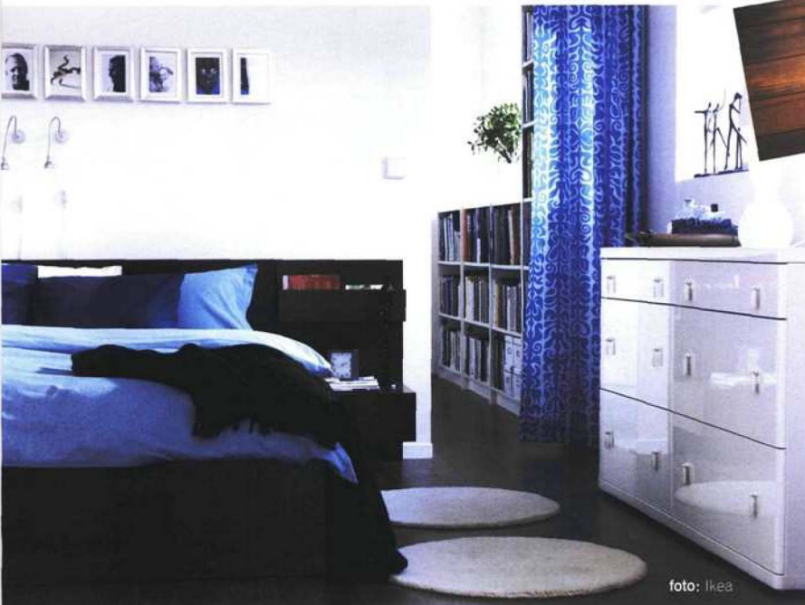
gotovi, lakirani parket od bukve, 60-120x9 cm

S obzirom na strukturu, parketi mogu biti masivni, od PUNOG DRVETA , i VIŠESLOJNI (dvoslojni i troslojni), a s obzirom na završnu obradu razlikujemo nauljene i LAKIRANE (gotove) parkete, te SIROVE gdje se završni sloj postavlja nakon polaganja parketa na površinu prostorije. Naravno, tu je i podjela parketa prema vrsti drveta, pri čemu pojedine vrste više odgovaraju uz, primjerice, rustikalni interijer, a druge uz moderni... Parket također može biti prirodnog izgleda, lakiran BEZBOJNIM LAKOM , ili bojan u svjetlije ili tamnije nijanse.