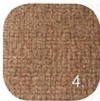
4. tepisi Grace za prirodni izgled terase, 140x200 cm