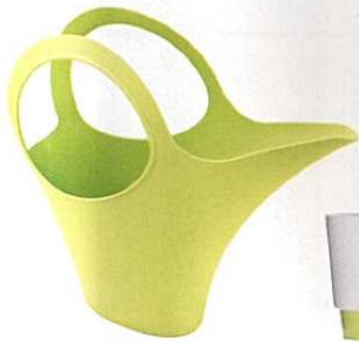
kantica za zalijevanje u veselim bojama - 145,90 kn, Koziol, Home Sweet Home