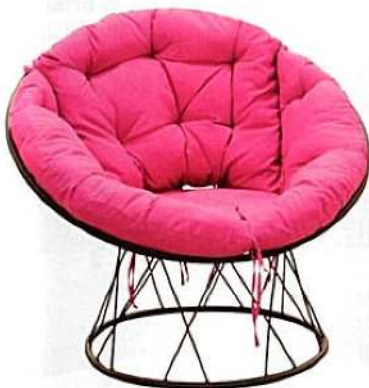
Totti vrtna fotelja s jastukom - 699,99 kn i crni metalni stol Stressa - 399,99 kn, Emmezeta