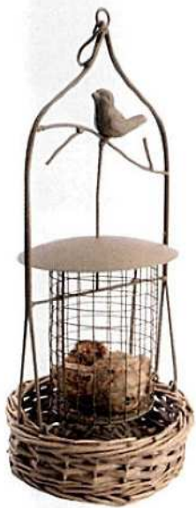
hranilica za ptice Chievo - 99 kn, Jysk