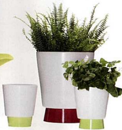
posuda za cvijeće s tanjurićem - od 4,99 eura, Ikea