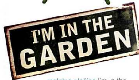
metalna pločica I'm in the garden, dim. 15.5x39 cm - 9,9 eura, Car möbel webshop

SKLOPI ME, RASKLOPI ME! Funkcionalno rješenje za manje terase su sklopivi stol i stolci koje je moguće slagati jedan na drugi. Na taj način namještaj zauzima manje mjesta tijekom skladištenja, u razdoblju hladnijeg dijela godine.