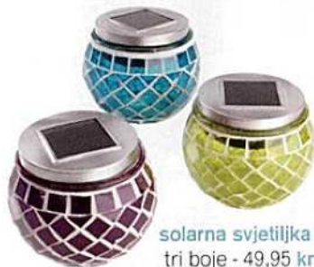
solarna svjetiljka u tri boje - 49,95 kn, Jysk