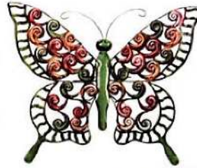
leptir kao dekoracija za vrt ili fasadu - 99,99 kn, Kika

CVJETNI MOTIVI, RAZIGRANI, POETIČNI UZORCI na podu, stolu ili fasadi stvaraju plodno tlo za relaksaciju i ugodno druženje.