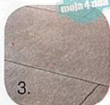
1. pločice Rain Forest, dim. 32.2x48.5 cm - 376,20 kn/m 2 i 2. Ancient Jerusalem dim. 15.9x15.9 cm - 271,70 kn/m 2 (319,77 kn i 230 kn za članove Kluba), Lea Ceramice, Špina, 3. Serena, dim. 30x60 cm