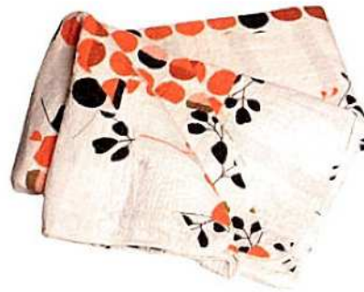
bijelo-narančasti prekrivač, dim. 250x230 cm - 799 kn, Home Sweet Home