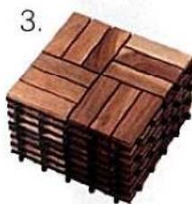
3. praktične podne ploče Platta od bagremovog drva