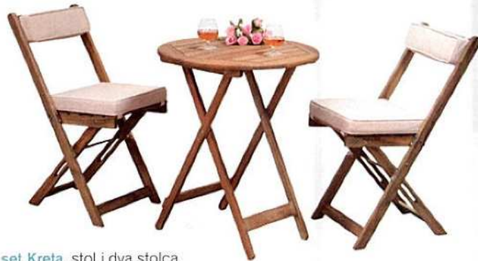
set Kreta, stol i dva stolca s jastucima - 599,99 kn, Emmezeta

SKLOPI ME, RASKLOPI ME! Funkcionalno rješenje za manje terase su sklopivi stol i stolci koje je moguće slagati jedan na drugi. Na taj način namještaj zauzima manje mjesta tijekom skladištenja, u razdoblju hladnijeg dijela godine.