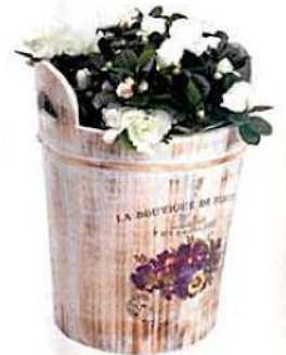
drvena shabby posuda za biljke - 99 kn, Jysk

CVJETNI MOTIVI, RAZIGRANI, POETIČNI UZORCI na podu, stolu ili fasadi stvaraju plodno tlo za relaksaciju i ugodno druženje.