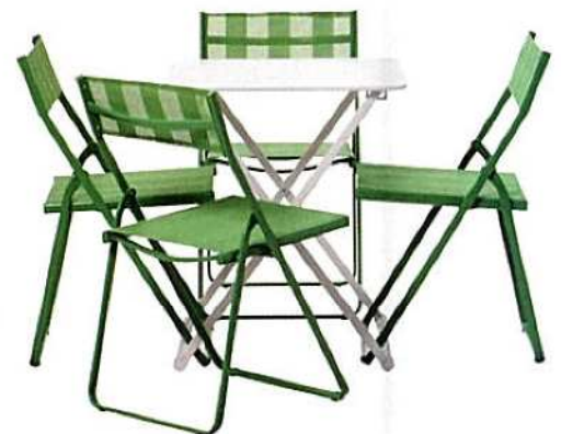
bijeli metalni stol na rasklapanje - 19,99 eura i metalni stolci u nekoliko boja - 14,99 eura, Ikea