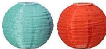
solarna svjetiljka Azur visine 30 cm - 49,95 kn/2 kom., Jysk