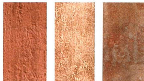
keramičke pločice u mediteranskom stilu: Manufacto Cotto, dim. 15x30,4 cm Sadon Etruria, dim. 15x30,4 cm Taverna di Bacco Rubino, dim. 17x34 cm

U mediteranskoj arhitekturi često susrećemo keramičke pločice od terakote dobivene pečenjem prirodne gline na minimalnoj temperaturi od 700°C. Vrlo ih je lako održavati, a zub vremena samo im daje još više šarma. Njihova jednostavnost i toplina odličan su odabir za moderne mediteranske kuće koje prizivaju tradiciju. Nalazimo ih na terasama, u kuhinji, blagovaonici, hodnicima... Razmišljate li o opločenju, uvijek kupite 10% više pločica (zbog neophodnog rezanja), a postavljate li ih dijagonalno, neka ih bude 15% više. Mokre pločice često mogu biti skliske pa prilikom čišćenja obujte obuću s gumenim potplatom. Želite li potpuno pomladiti izgled vaših pločica od terakote, premažite ih lanenim uljem! Prije svega, maknite sav namještaj iz prostorije i koristite lagani premaz koji ćete mekom krpom rasprostraniti po čitavoj prostoriji, od zida do zida. Ostavite neka se suši 24 sata te vratite namještaj na svoje mjesto. Pri čišćenju pločica od terakote treba izbjegavati jake kemikalije koje bi mogle oštetiti pločice ili im čak promijeniti boju.