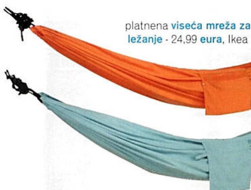
platnena viseća mreža za ležanje - 24,99 eura, Ikea