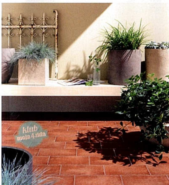
keramičke pločice Etruria Bianco, dim. 15x30 cm