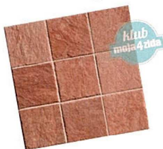
keramika I Tutti, dim. 16x16 cm Emil Ceramica,