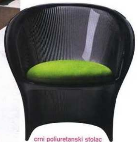
crni poliuretanski stolac Flower za vanjske prostore