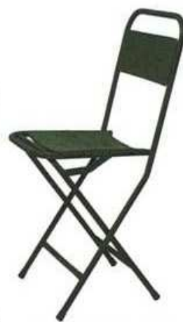
zeleni sklopivi stolac od lijevanog željeza -

Istarske stancije postaju sve češća inspiracija pri uređenju vlastitoga doma. Kamene fasade i grilje na prozorima u tradicionalnim bojama stvaraju opuštajući osjećaj kao da ste cijele godine na odmoru. I terase prate ovaj ladanjsku ugođaj - podovi od keramičkih pločica rustikalnoga uzorka, vrtna garnitura od kovanog željeza, cvijeće za vanjske prostore - i stvorili ste ugođaj dostojan pravoga ljetnikovca!