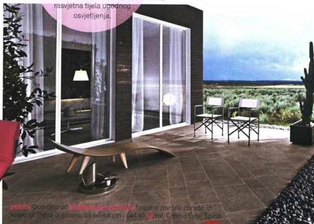
stolica: Guerceto od www.guerceto.com hrpave završne obrade: iz kolekcije Pietra di Luano, 59,4x59,4 cm - 644,40 /m 2 . Cotto d'Este Spina