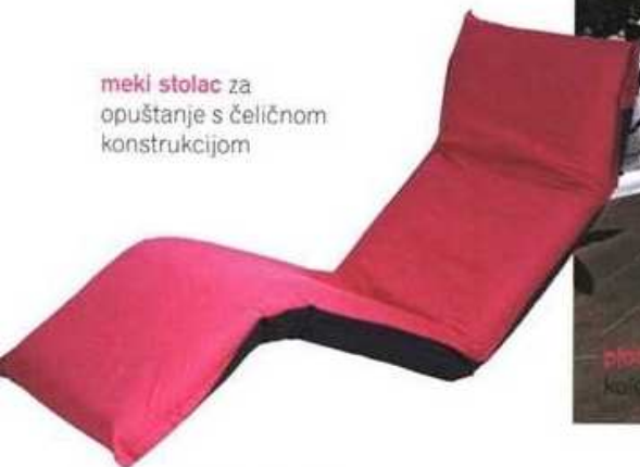
meki stolac za opuštanje s čeličnom konstrukcijom