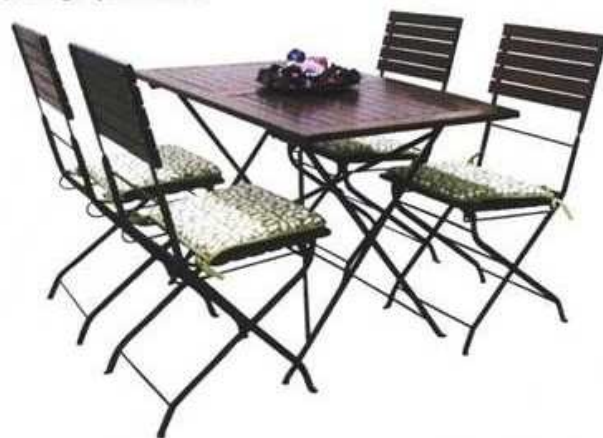
vrtna garnitura Bergamo u kombinaciji kovanog željeza i drva akacije, sklopivi stolac