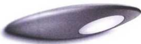
snažna okrugla reflektorska svjetiljka za vanjske prostore

Sofisticirani dizajn i futuristički oblici predstavljaju neobično osvježanje u vrtnom namještaju. Za neodoljiv večernji ugođaj dodajte im minimalistička rasvjetna tijela ugodnog osvjetljenja.