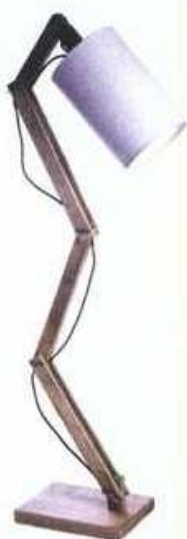
teleskopska podna lampa visine 160 cm koja će se lako prilagoditi svim kosinama - 2.850 kn, Madam Stoltz, Bakina škrinja