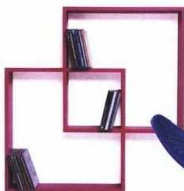
zidna polica Square izrađena je od medijapana te dolazi u raznim bojama - 483 kn, Kare Design