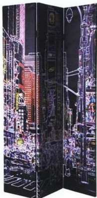
paravan Traffic , izrađen od platna i drveta, s obje strane krasi slika - 1.621 kn, Kare Design