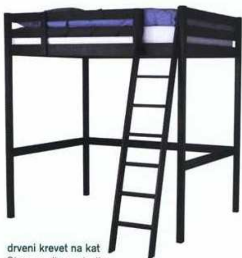
drveni krevet na kat Stora za djecu stariju od 7 godina, dim. 213x153x214 cm - 249 eura, Ikea