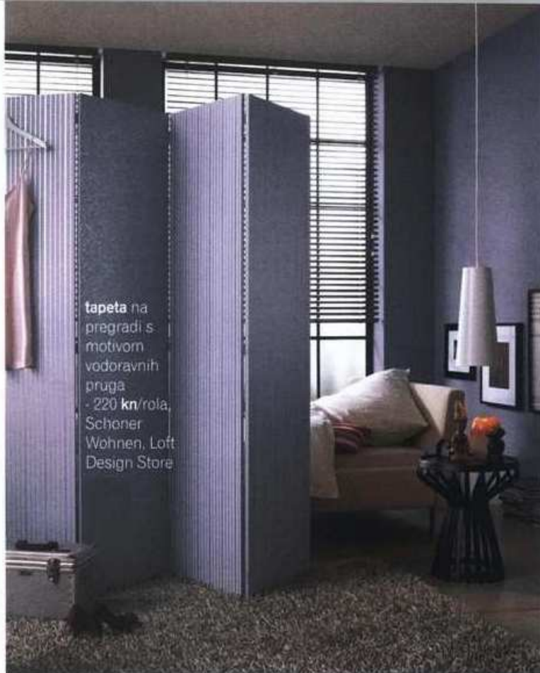
tapeta na pregradi s motivom vodoravnih pruga - 220 kn/rola, Schöner Wohnen, Loft Design Store