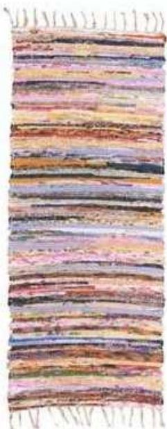
Šareni pamučni tepih, 50x120 cm Emmezeta

idealan su izbor za zidove, a ako se odlučite za tapete neka one budu nježnoga i decentnoga uzorka. Zabavite se kombiniranjem starog i novog - od namještaja preko posteljine do ukrasnih detalja, koji će prostor učiniti dinamičnim, sa snažnim pečatom vaše osobnosti.