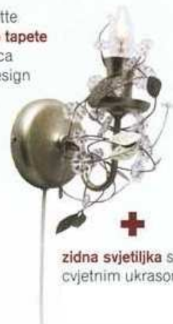
zidna svjetiljka s cvjetnim ukrasom