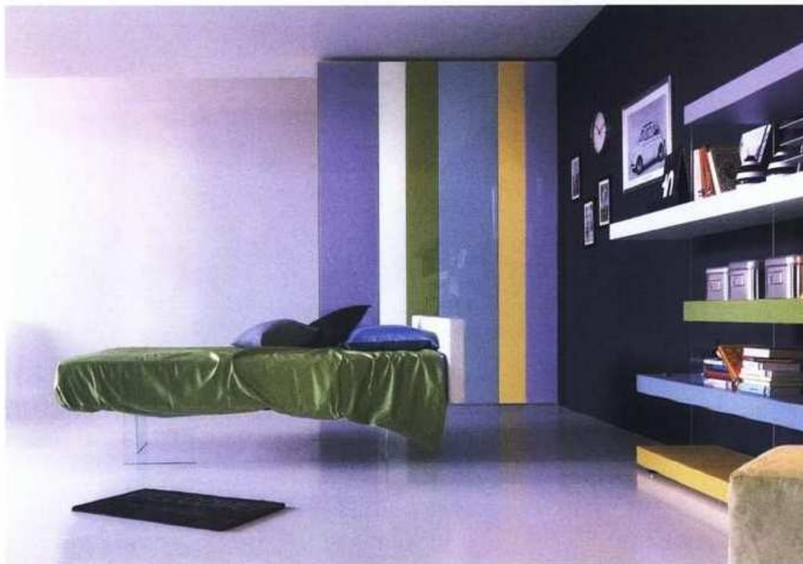
krevet Air - Lago

Ovu vještinu moguće je savladati uz pomoć kreveta koji se drži na - kristalnim panelima. S obzirom da su oni gotovo nevidljivi na prvi pogled, čini se da krevet doista lebdi u prostoru. Bilo da imate želju lebdjeti na čilimu ili pak dosegnuti duhovne vrhunce, ovaj krevet je dobar početak. Visina kreveta može se regulirati rotiranjem staklenih podupirača ispod metalne baze. A na platformi ispod madraca nalaze se prikazi dvadeset poza Kama Sutre, ako zatreba!