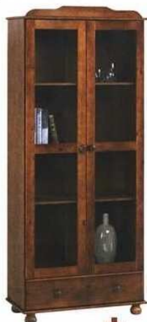
vitrina od borovine, 85x189x35 cm