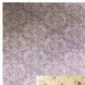
tapete iz kolekcije Jette cvjetne tapete iz kolekcije Romantica Loft Design Store