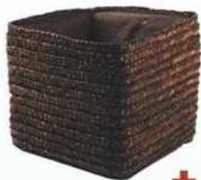
smeđa košara od polipropilenskog vlakna