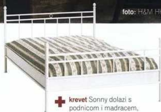
krebet Sonny dolazi s podnicom i madracem, 140x200 cm