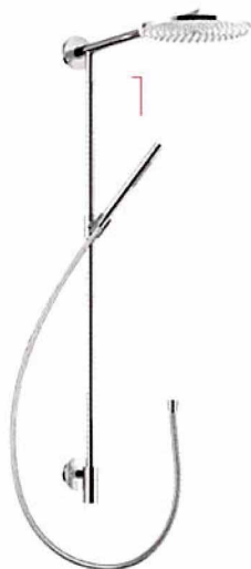
1. nadglavni i ručni tuš Raindance Connect