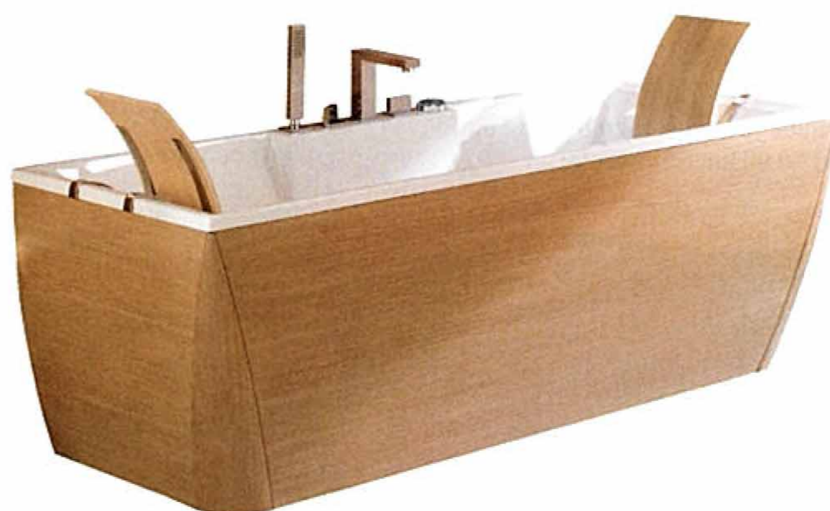
samostojeća kada decentnog dizajna Naja'-Art s bojom obloge u svijetlom hrastu ili wenge, 170x70 cm