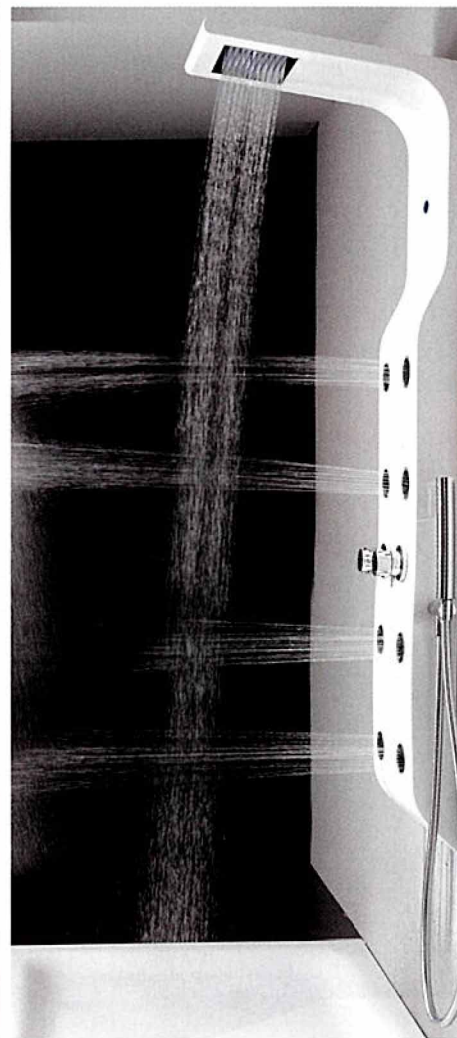
tuš kabina Zero iz kolekcije Hi-Design, s hidromasažnim sustavom