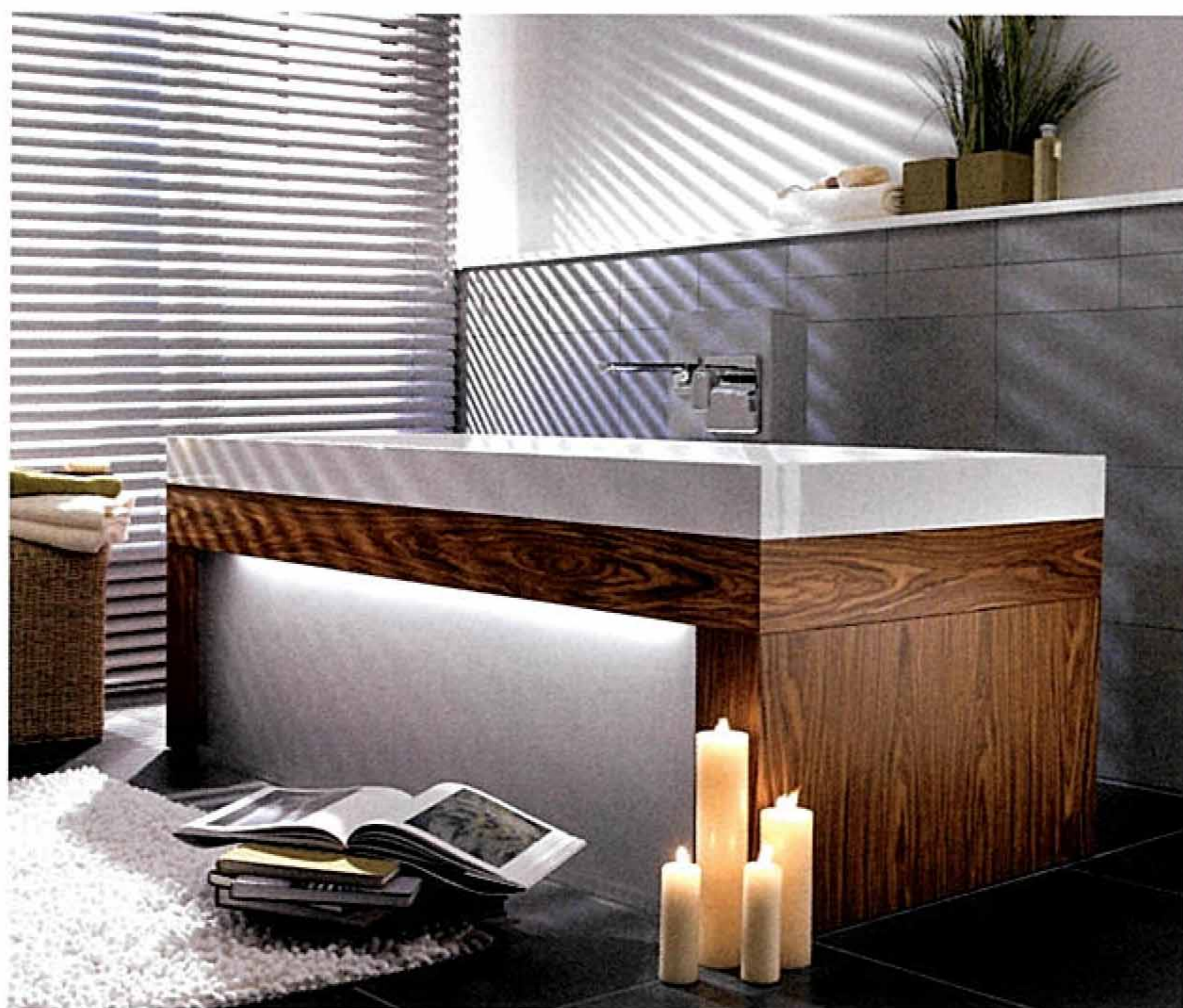
kada City Life s drvenom oblogom i ugrađenom rasvjetom -