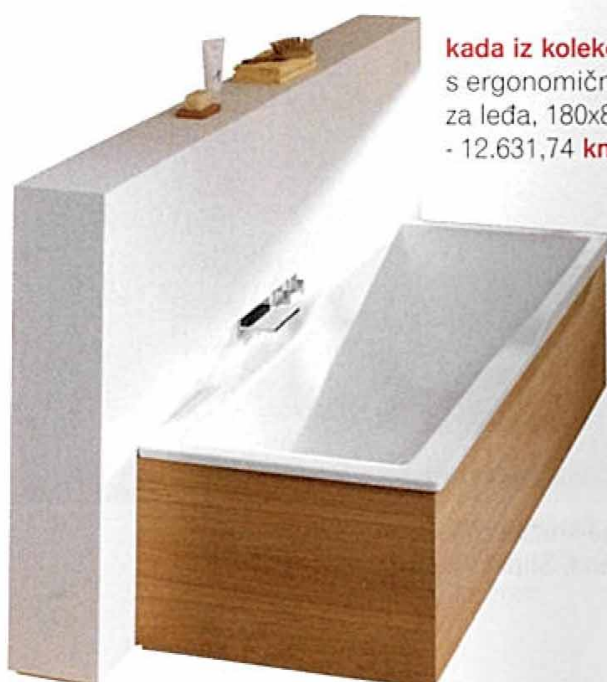
kada iz kolekcije BettePlan, s ergonomičnim osloncem za leđa, 180x80 cm - 12.631,74 kn, Bette, Špina

Terapija vodom temperature oko 37°C, što je ujedno naša tjelesna temperatura, pomoći će nam da lakše zaspimo jer povoljno utječe na živčani sustav, smirujući nas i pripremajući za počinak.