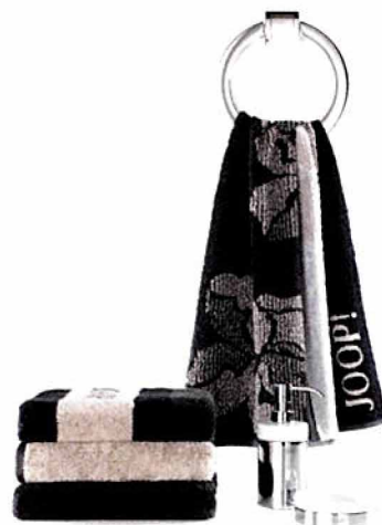
ručnici raznih boja i dimenzija