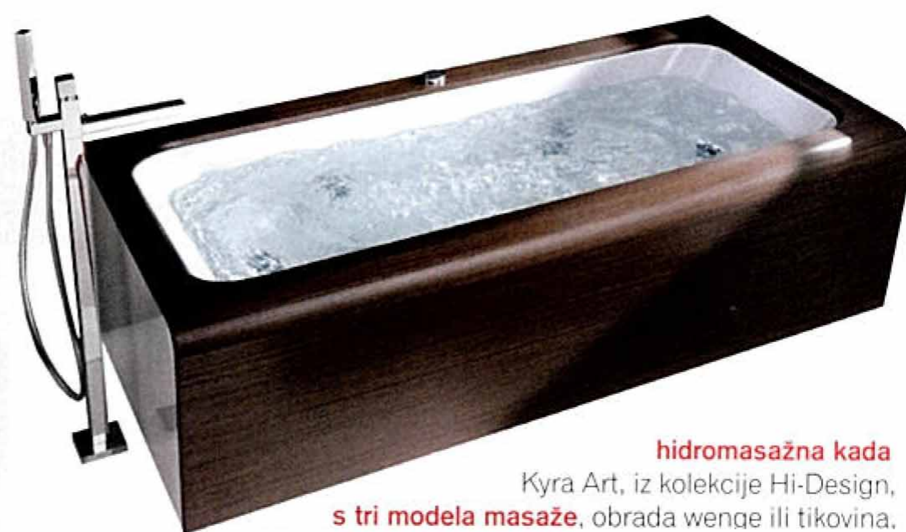
hidromasažna kada Kyra Art, iz kolekcije Hi-Design, s tri modela masaže, obrada wenge ili tikovina.