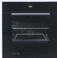
pećnica DOP792B s digitalnim upravljanjem i interaktivnim programatorom - 12.041,70 kn, De Dietrich, Gemma B&D