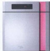
ugradbena pećnica BOB7KR s elektronskim upravljačkim modulom i funkcijom samočišćenja - 6.999 kn, Gorenje