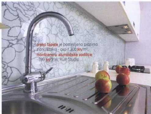
preko tapete, je postavljeno prozorno zidno staklo - oko 1.300 kn/m 2 , montirano u aluminijske vodilice - 699 kn/3 m, Kult Studio

Dobri stari štednjak iz naših kuhinja sve više istiskuju odvojeni uredaji za kuhanje, a tome su razlog njihova funkcionalnost i estetski dojam. Naime, odvajanjem kuhlne ploče od pećnice na raspolaganju su vam brojne mogućnosti ugradnje, osobito pećnice, koja sada ne mora biti u sklopu donjih elemenata već može biti u razini odrasloga čovjeka. Osim što je praktično jer se ne morate saginjati, ovo je ujedno i sigurno rješenje, jer je na taj način izvan dohvata djece i ljubimaca. Sa estetske strane, ovi se uredaji ugrađuju u kuhinjske elemente, čineći s njima daleko kompaktniju i atraktivniju cjelinu.