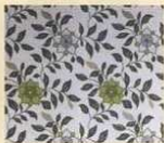
dekor keramičke pločice iz kolekcije City Lights, 25x40 cm - 283 kn/kom 226,40 kn za članove Kluba), Viva, Šona, zidne tapete cvjetnoga uzorka - 217 kn/rola, Pretty Style, Loft Design Store