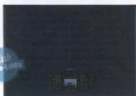
ugrđena električna indukcijska ploča širine 78 cm sa zaslonom - 7.039 kn (6.335,10 kn za članove Kluba), AEG, Elux Store