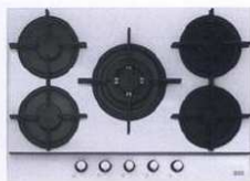
ploča za kuhanje FHC705 od bijelog stakla s pet plamenika i uklonjivim toplinskim štitom na magnet - 5.147,55 kn, Franke, Gemma B&D