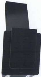
staklena zidna napa DKG552 širine 55 cm - 4.799 kn, Gorenje