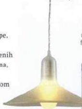
bijela silikonska visilica Flexlamp - 525 kn, Droog Design, Modus Design Shop

Razvoj tehnologije te njegova neodoljiva prozračnost i dojam lakoće učinili su staklo jednim od omiljenih materijala u kuhinji. Nape, elementi, zidne obloge - svi se oni danas uobičajeno sastoje i od staklenih dijelova. Prilagodljivost, igra bojama, teksturama i motivima koju ono dopušta čine ga nezostavnim dijelom kuhinja različitih stilova.